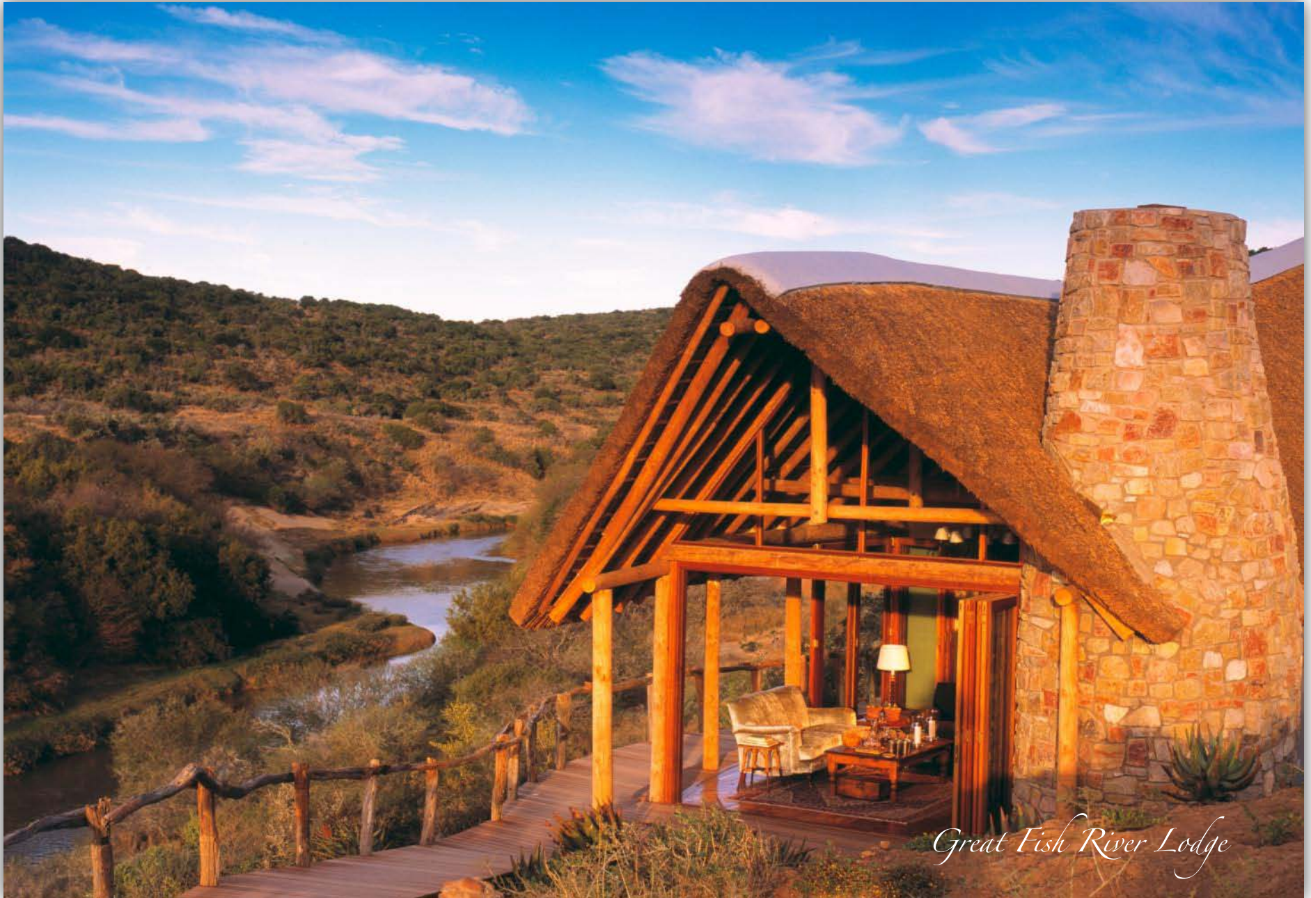
Great Fish River Lodge