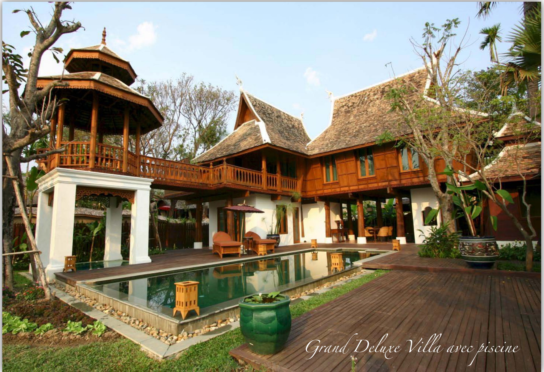
Grand Deluxe Villa avec piscine