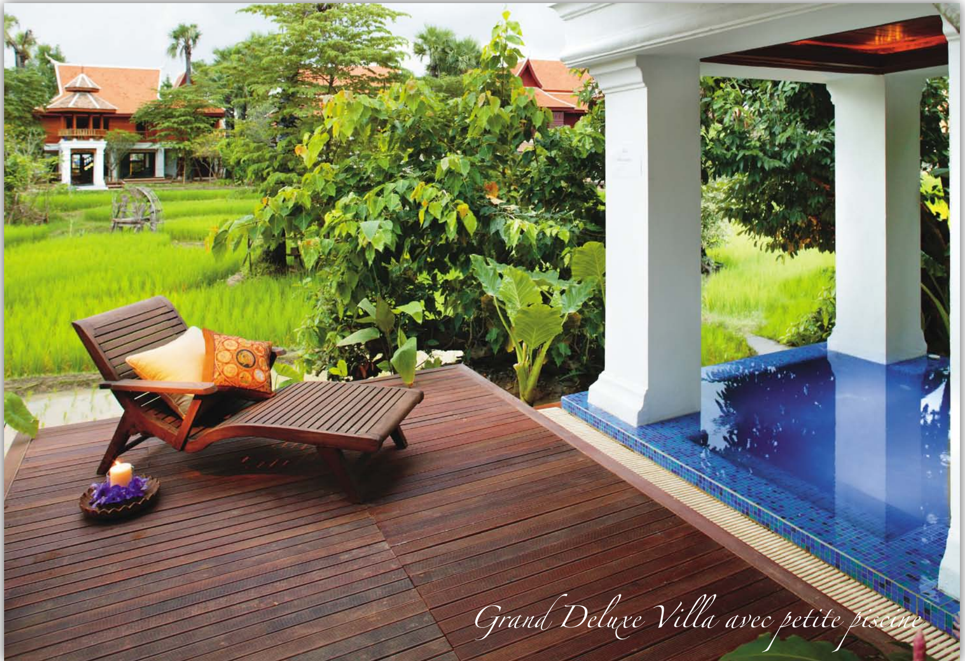
Grand Deluxe Villa avec petite piscine